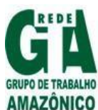
Grupo de Trabalho Amazônico - GTA